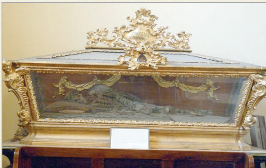
A templomban látható Szent Ince vértanú múmiája