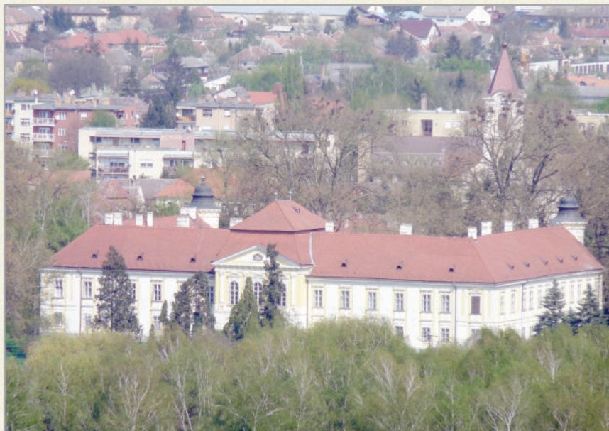
A Batthyány-kastély a legismertebb a turisták körében

Így a megye várainak többségét felrobbantották, lebontották. A kisebb