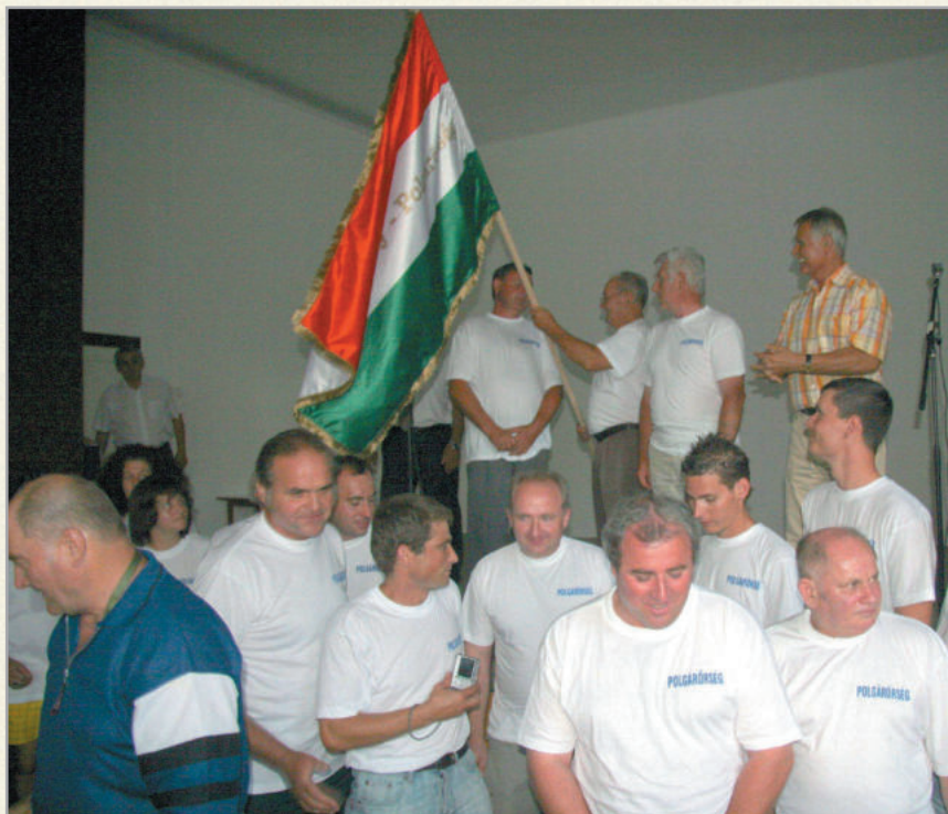
Zalakoppányban több civil szervezet, így polgárőrség is működik

A település legmagasabb pontján álló temploma műemlék jellegű, udvarában található a hősi emlékmű. A valóban szép, mondhatni vadregényes környezetben fekvő településen számos külföldi, s magyar család vásárolt birtokot és házat az elmúlt esztendőök során. Ezek felújításával szépült a városrész, melynek felújított kultúrházában egyre több rendezvényt tartanak. Az idősek napja mellett évente megrendezik a zalakoppányi borok versenyét, melyben mindenki megízlelheti a kiváló zamatú nedűket. A városrészben az augusztus 15-ét követő vasárnap tartják a búcsút. Az infrastruktúra kiépítésére is nagy gondot fordít a részönkormányzat.