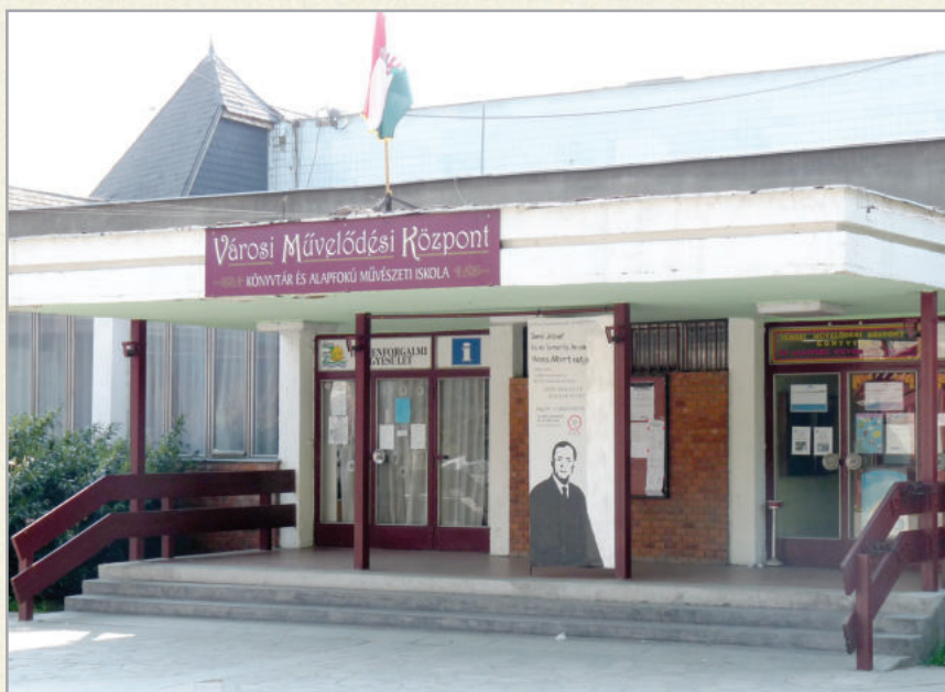
A Városi Művelődési Központ, Könyvtár és Művészeti Iskola