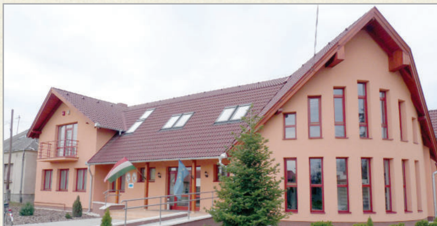
Zalacsány központjában nemrég készült el az új községháza

A kastélyban és a hozzá épített egyszerű szárnyban gyermekotthon működött a 80-as évek végéig. Néhány évi gazdáltság után 2000 elején befejeződött az egész épületegyüttes átalakítása, felújítása. Az országban egyedülálló, saját termálkúttal rendelkező szálloda üzemel, mellette újabb szálláshelyek épültek. Nem messze a Malatinszky kastély várja a vendégeket, az ugyanis szintén szállodaként üzemel, 1991-ben töltötték fel a ma már horgászokat, csónakázókat fogadó tavat. Nyaranta nagy népszerűségnek örvend a „szabadidő-park”. Az erdők aljában lovastelep és lovasklub húzódik meg. Zalacsány határában ír befektetők golfpályát kezdtek építeni.