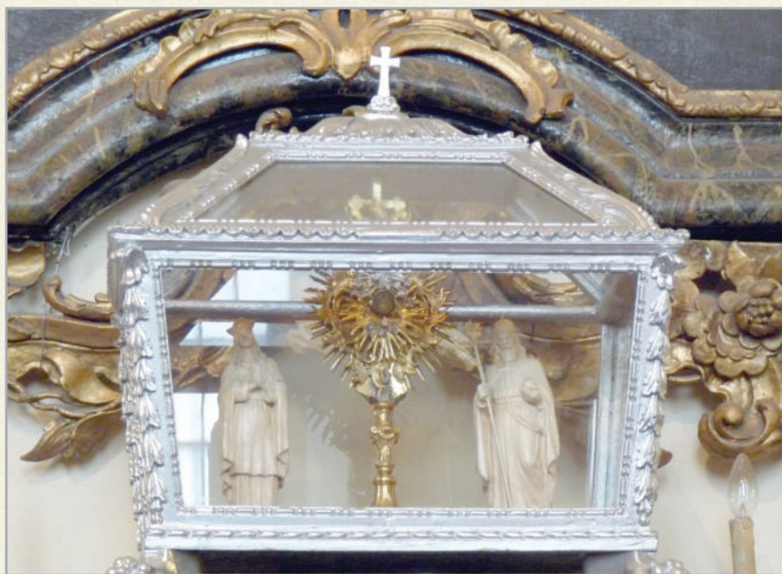
Az épület minden része gazdagon díszített