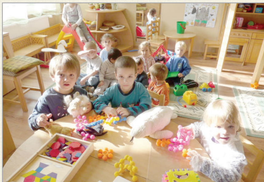
A megújult óvoda kellemes körülményeket biztosít a gyerekeknek