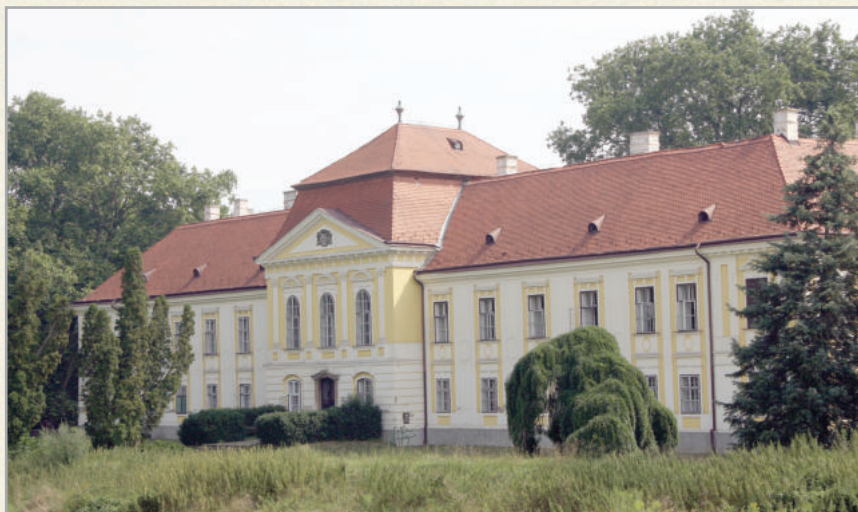
A Batthyány-kastély Zalaszentgrót történelmi jelképe

A kalocsai és a pécsi püspökök között 1083-ban létrejött püspök megyei határrendezés alkalmával Zalaszentgrótról Szent Gróth néven tesz említést a Pray-kódex. Az első okleveles említése 1247-ből származik, nevét Szentgerolt-nak írták az oklevélben, melyben az olvashatjuk, hogy Szentgróti Dénes négy telket, a Zala vízén egy két kerékre járó malmot és a szentgróti vám felét a türjei monostornak adományozta. 1247-ben már nem lehetett jelentéktelen település, ha birtokosa, a Türje nemzetségbeli Dénes magát megkülönböztetésül szentgrótinak nevezi és Holub József szerint IV. Béla 1265. november 25-én itt adta ki egyik oklevelét. A helység gyors fejlődését jelzi, hogy forrásai 1397-ben már mezővárosnak, oppidium-nak mondták és Szent Balázs napján országos vásárokat tar-