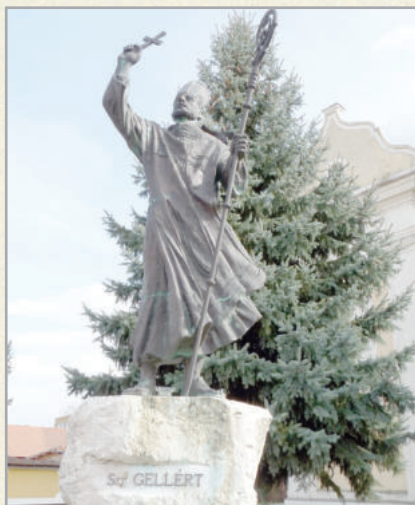
A város névadója, Szent Gellért szobra