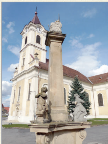
A 250 éves katolikus templom a Szentháromság szoborral

A Historia Domus írja:”A szentgróti plébánia házánk egyik legrégebb plébániái közé tartozik, a 14. századból. A régi plébániáról ma nincsenek adataink, a törököknek hazánkban dűlása és pusztító keze Szala völgyére is kiterjedvén