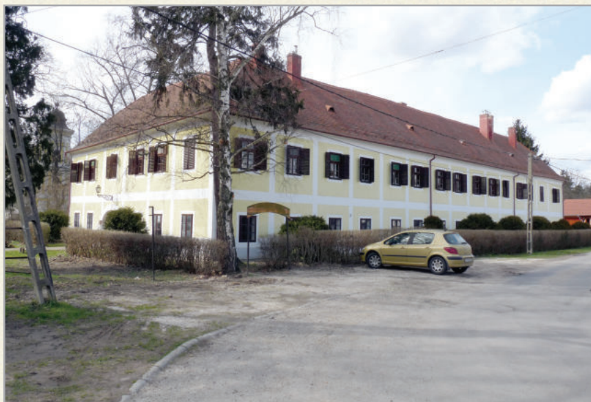
A Kiskastély nemrég megújult épülete