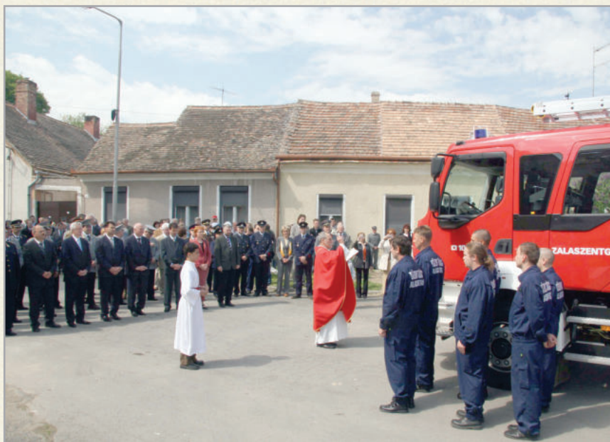
Tűzoltónap a városban