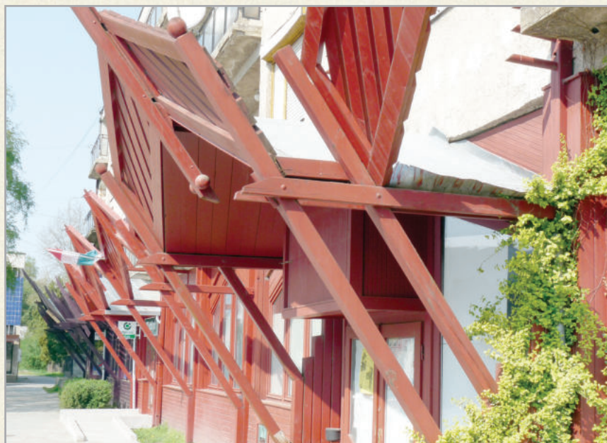
A városba látogatók egyedi építészeti megoldásokkal találkozhatnak