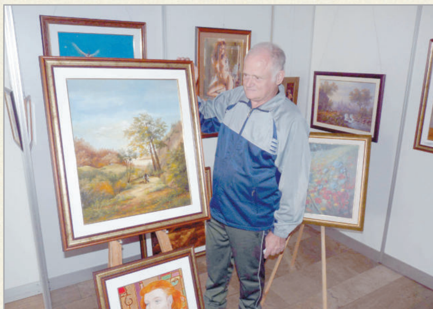
Az őszi és tavaszi tárlat közel 40 éves múltira tekint vissza