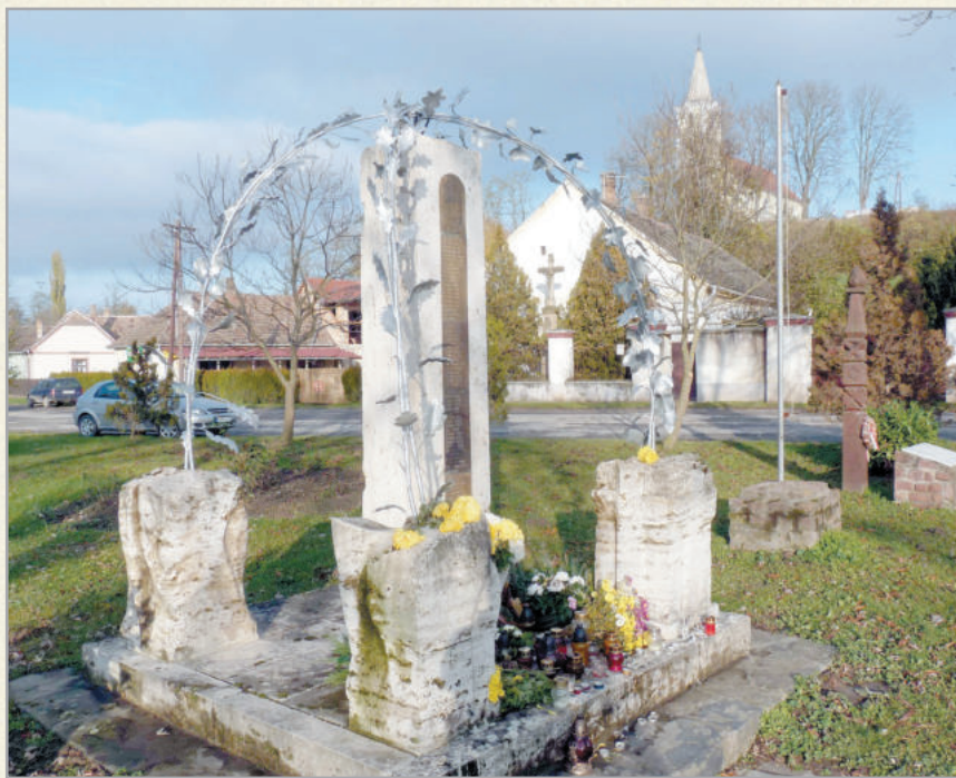
Tekenye központja az emlékművel

A Vérbulcsú törzséből származó Tekenye nemzetség a honfoglalás után e vidéket szállta meg, s a település e nemzetség nevét őrizte meg. 1333-ban már egyháza volt, 1720-ban nemesi igazgatás alatt állt, s 728 lakosa volt. A község az elmúlt években igazi fejlődésen esett át. Az infrastruktúra kiépítése mellett a városrész mindenkori vezetése kiemelt figyelmet fordít arra, hogy a lakosság ne költözzön el. A nevezetes ünnepeket mindig közösségben tartják, ahogy az idősök számára is rendezvényeket szerveznek. A hagyományos nyári pogácsafesztiválon mindig tömeg van, de emellett a gyermekekre is kiemelt figyelmet fordítanak: számukra játszóteret is kialakítottak, az ünnepek előtt pedig játszóházat is indítanak. Temploma 1748-ban, a község központjában lévő temetődombon a régi kápolna helyén épült. 1913-ban szentélyt csatoltak hozzá, benne gyönyörű oltárral, melyet Szent István, Szent László, Pál és Péter apostol szobrai díszítenek.