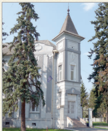
A rendőrség jellegzetes épülete a Dózsa György utcában