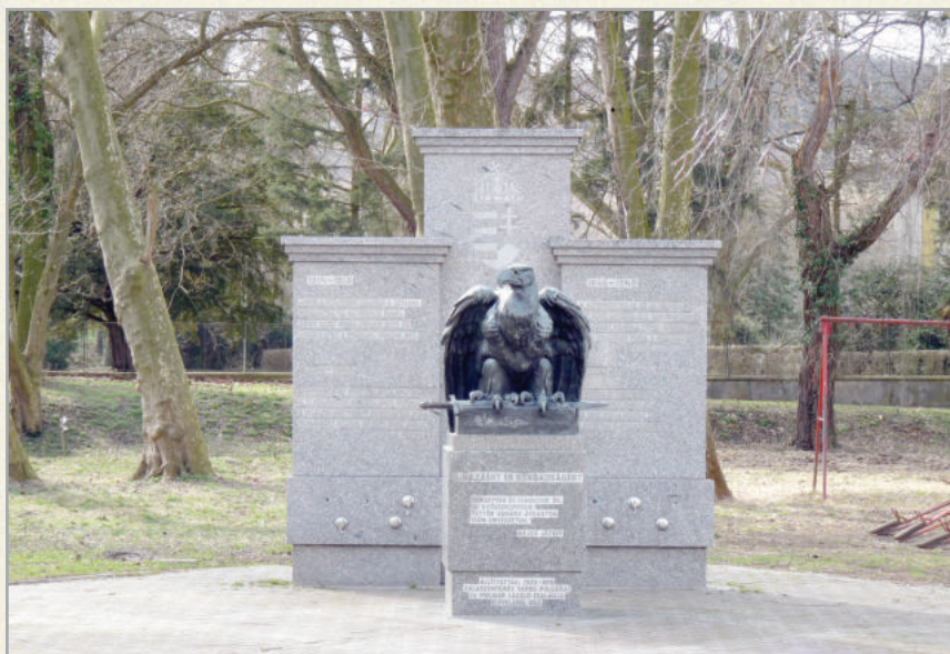
Történelmi emlékmű a turulmadárral