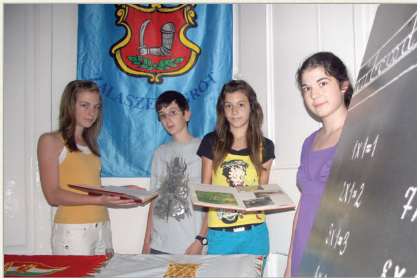
A Csányi-Zrínyi Általános Iskola története kiállítás formájában is megjelenik

A műemlék épületegyüttesben, a Batthyány-kastélyban 1950 októberétől gyógypedagógiai intézmény, a Koncz Dezső gyógypedagógiai intézet működik.