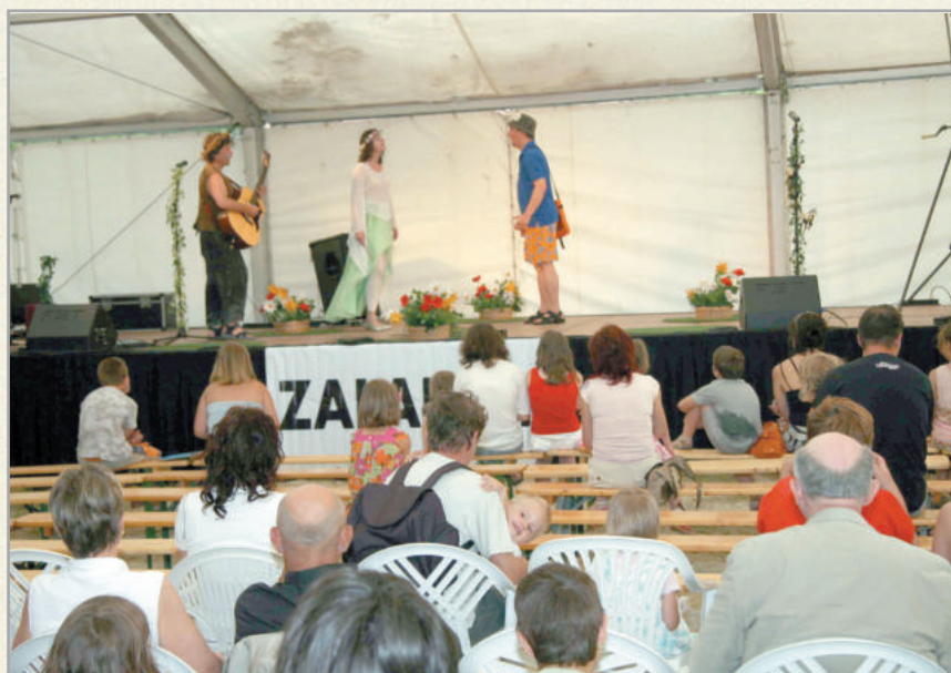
A Zalavölgyi Kultúrtivornya változatos programokat kínál