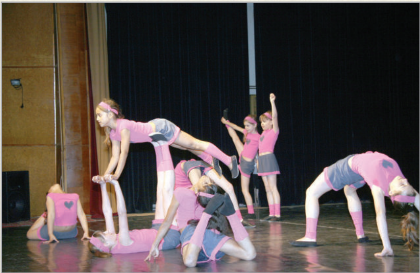
A Városi Művelődési Központ kulturális bemutatók színhelye