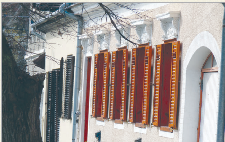
Hangulatossá teszik a városképet a zsalugáteres épületek