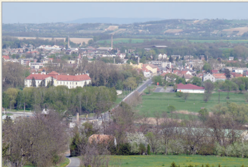
Zalaszentgrót, a 100. magyar város madártávlatból

Éghajlata a Földközi-tenger és az Alpok közelsége miatt nem szélsőséges. A kellemes, meleg nyarakat 800-900 mm csapadékot hozó ős és nem túl hideg tél követi. A tavasz különösen szép a környéken. Nemcsak az utakat szegélyező gyönyörű fáktól, hanem az erdőkben fehér lepelként