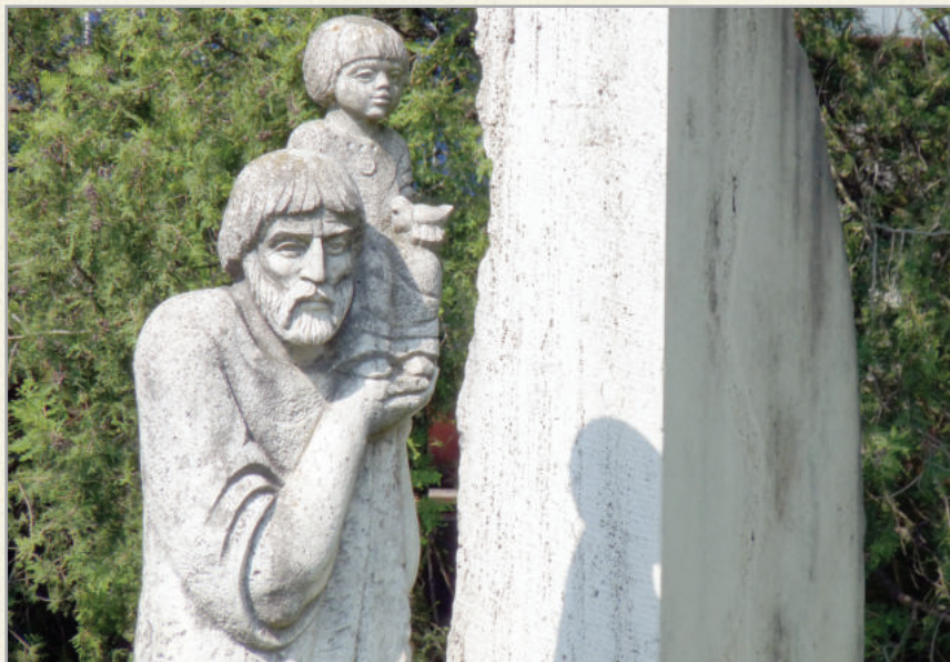
Szoborcsoport a Szent István téren

A templom hajójában oldalt áll a fájdalmas szűz oltára, mely egykorú a templommal, mert díszítése, színezete megegyezik a templom díszítményeivel. Tabernakuluma tetején áll Szent Imre ereklyéje. Az északi falon kapott helyet a szószék, mely fából készül, t aranyozott faragványokkal, s három domborképpel díszítették. A kórus teljes egészében fából készült,