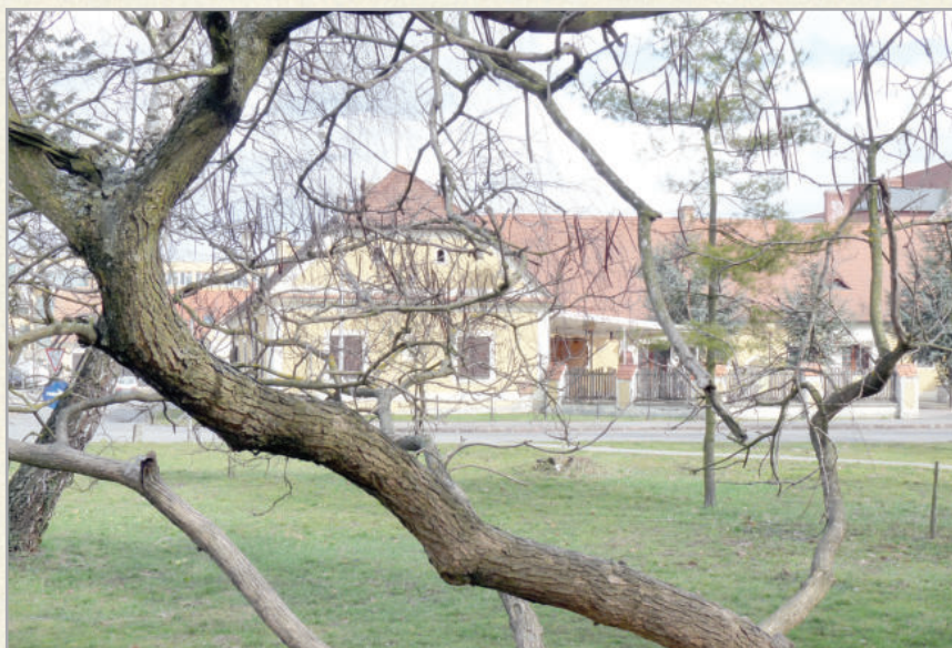
A kastély melletti parkban kellemes körülmények között lehet pihenni