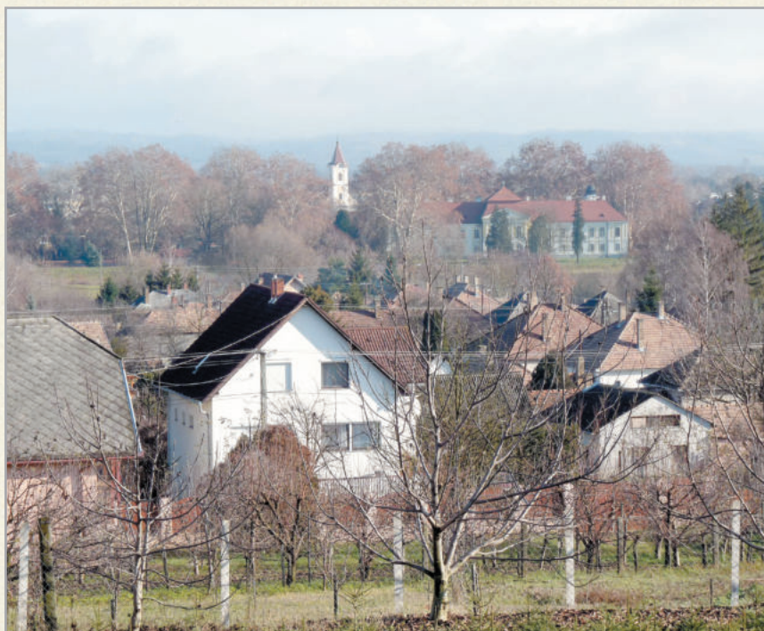
Az aranyodi szőlőhegyről pazar a panoráma

Zalaszentgrót városrésze, mely a XVI. században a Harkályi illetve Salamonvári család birtokai közé tartozott. E család kihalásával a következő évszázad első felében és még 1458-ban is a herbortyai Ostfiak és a Mavotichok kezében volt. 1828-ban 33 házból állott, 270 lakossal, földesurai köznemesi családok voltak, lélekszáma 1851-ben 280 fő volt. 1900-ig Alsó- és Felső Aranyod névben két külön helységre volt osztva, e század elején egyesítették. A városrészben élénk közéleti tevékenység folyik, az elmúlt tíz év alatt sportpálya épült, megújult a kultúrház, s tisztelegve a két világháború áldozatai előtt emlékművet is állítottak. Több program, így a városrészi nap és a majális is hagyománnyá vált. Aranyodon az infrastruktúra is kiépült.