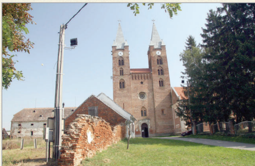
Túrje nevezetessége az Árpád-kori templom a Szent László legendával

Túrje szintén egyfajta központ a régióban, mintegy 2000 lakosával a térség legnagyobb települése. Legfőbb nevezetessége az Árpád-kori templom, melynek falán látható a Szent László legenda freskója. A templom mellett áll a rendház, melyben idősek otthona működik. Iskoláját nemrég építették át, bővítették.