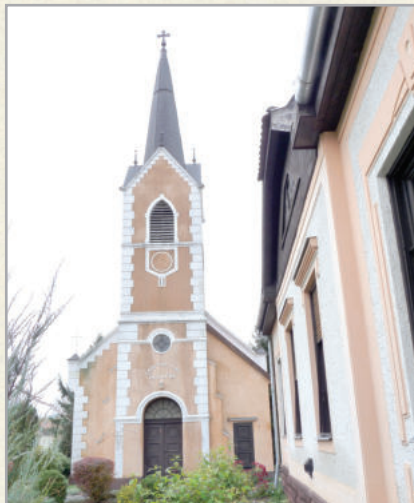
Az evangélikus templom és imaház 1912-ben épült

Az evangélikus templom és a mellette lévő imaház a 2000. évben teljesen megújult, a szentelést a millenium keretében tartották.