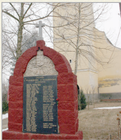
Zalavég. Világháborús emlékmű a templomkertben