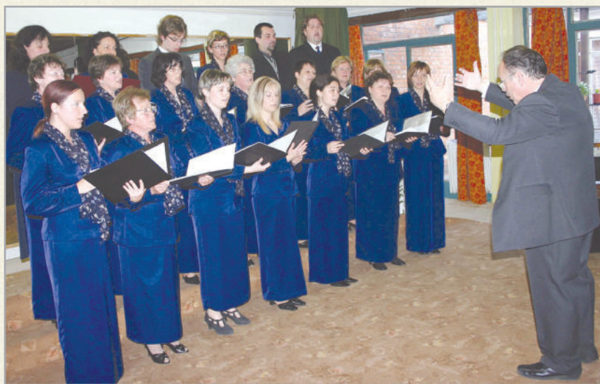
A Városi Kamarakórus