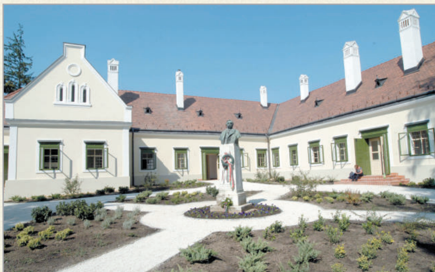
Kehidakustány nevezetessége a Deák-kúria