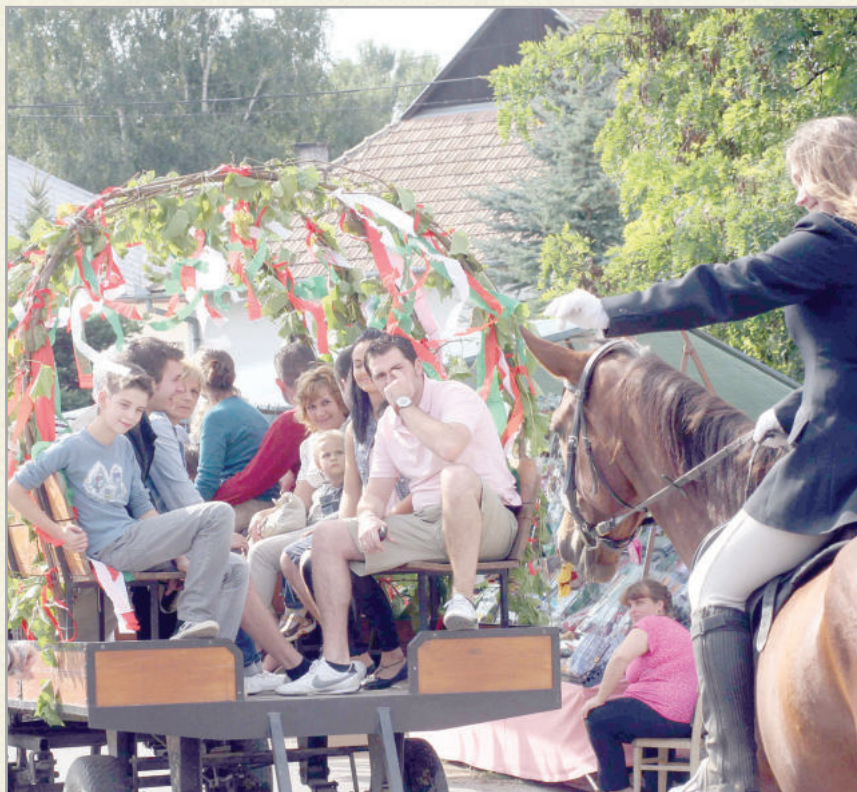
Szüreti felvonulás Kisszentgróton

Kisutca és Polgárváros elnevezés alatt találjuk a régi forrásokban. Valóban Szentgrót elővárosának, vagy külvárosának tekinthető, melyet a város szabad polgárai (iparosai, kereskedői) alapítottak és laktak. Ezért a volt polgárváros elnevezés is, megkülönböztetésül a vártól és a földesúr jobbágysai által lakott résztől. Története így azonosnak tekinthető Szentgróttal. A városrészben éppen történelmi múltja miatt jócskán akad látnivaló, ezek között is első számú a Romtorony, melyet szép park vesz körül. Ugyancsak érdemes megnézni a kis templomot, melyet néhány évvel ezelőtt egy régi iskolaépületből sikerült kialakítani, s Szent Gellért a védőszentje. Néhány esztendeje búcsút is tartanak a városrészben, méghozzá a Gellért napot követő vasárnapon.