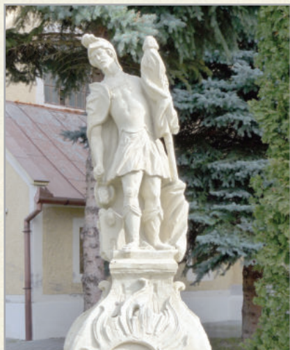
Szent Flórián szobra a templom mellett áll

A főajtó bejáratánál balról barokk Mária-szobrot, jobbról pedig a lengyel leszármazottak által adományozott szenteltvíztartót láthatja az aki a templomba lép.