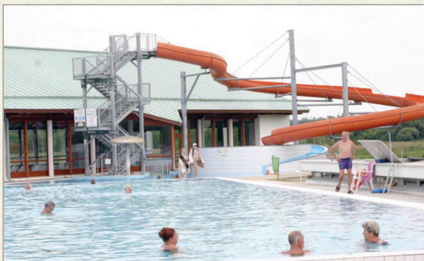
Az óriáscúszdát főként a gyerekek és a fiatalok kedvelik