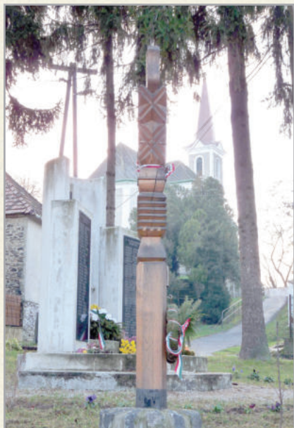
Sümegecsehi központja a világháborús emlékművel és a templommal

Az itt élő, vendégszerető emberek várják az erre járókat, az átutazókat, s különösen az itt megszállni kívánókat!