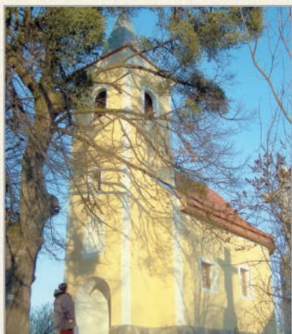
A zalabéri hegyi kápolna búcsúnak is helyet ad