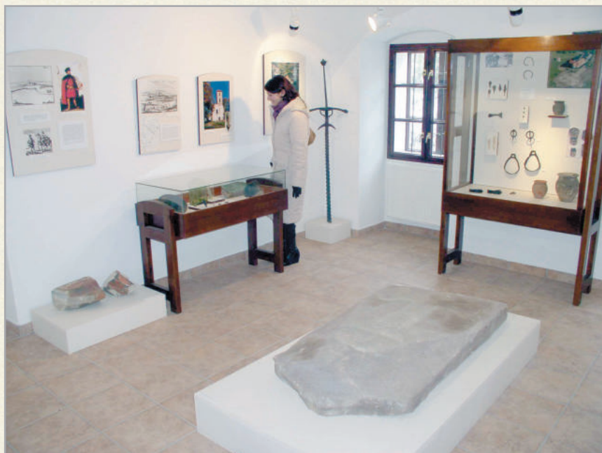
A városi múzeum a település múltjából nyújt gazdag ízelítőt

Az 1690-es években a várat elhanyagolták, egyszerű épületei főúri la- kásoknak nem voltak alkalmasak, dűledezni kezdett. Helyébe építették a