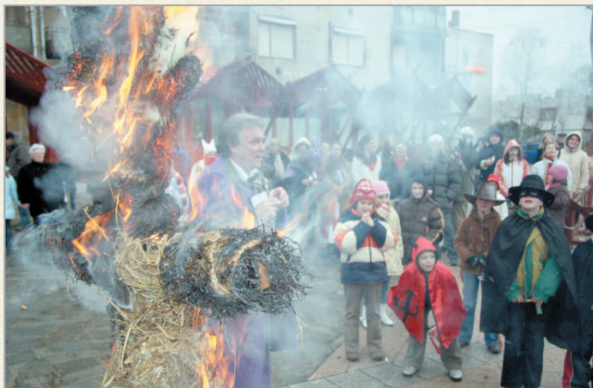
A télűző rendezvény egyre népszerűbb program