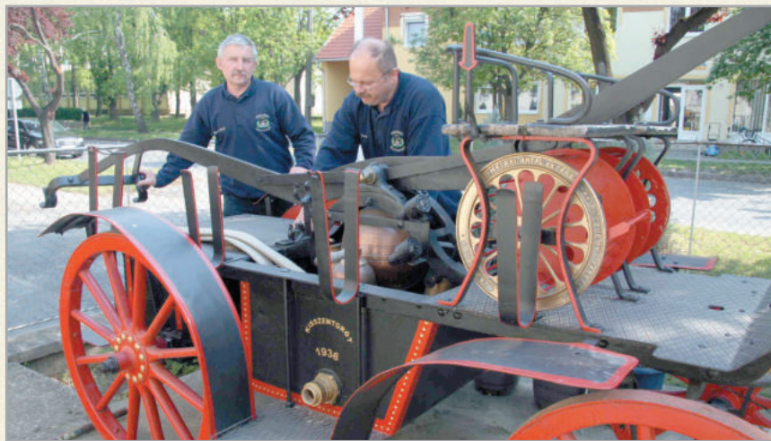
Az önkéntes tűzoltóság történelmi múltra tekint vissza

1963. nevezetes dátum a település életében, ekkor csatolták hozzá Aranyodot és Tüskeszentpétert.