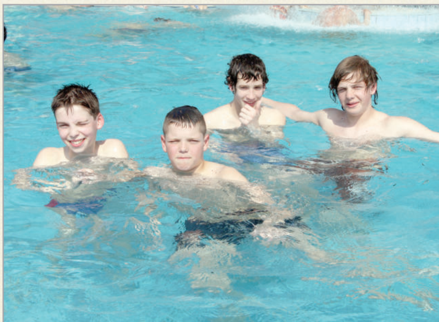
Az iskolások rendszeres vendégei a termálfördőnek