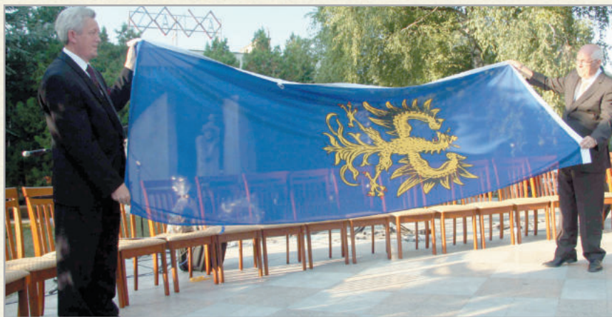
Germersheim polgármestere zászlót ajándékozott a városnak

A germersheimiek rendszeresen meghívják a zalaszentgrótiakat az Erőd fesztiválra, de az invitálás kölcsönös: a német település csoportja részt vett nyáron a zalai kisváros jubileumi ünnepségén.