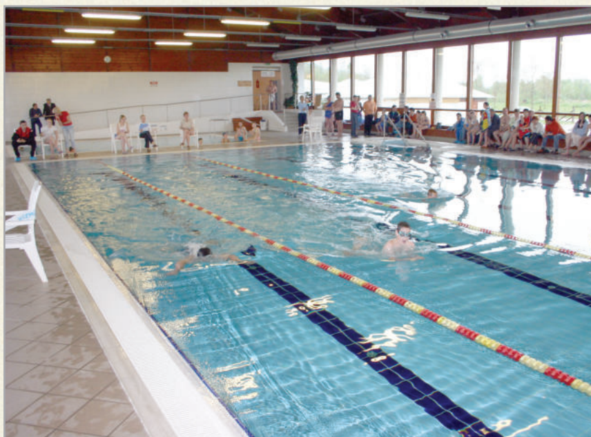
A fedett fürdő az úszók paradicsoma