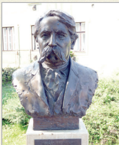
Deák Ferenc mellszobra a polgármesteri hivatal előtt