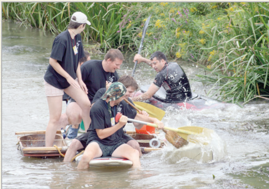
A Pusztika Oszika flúgos futamra több százan neveznek