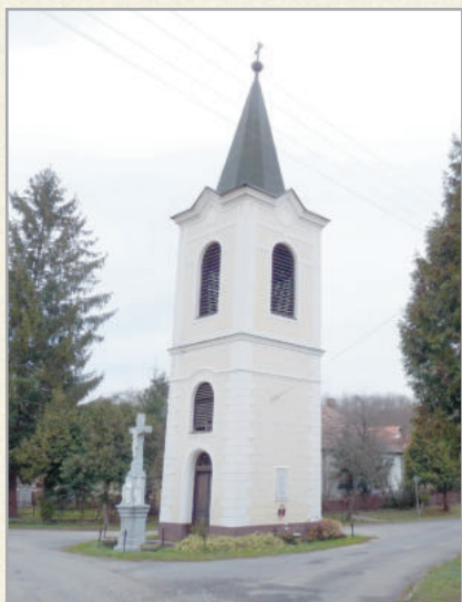
A sényei harangláb karakteresen meghatározza a faluképet

Sénye a Zalaszentgrót és Zalaszentlászló közötti útról érhető el, hosszú, kanyargós bekötőúton. A zsákfalu – mely nevét a Senye személynévből kapta -írásban először 1429-ben említette forrás. A mintegy negyven lakosú kicsi település festői környezetben fekszik, a dombokon szőlők és erdők váltják egymást. Gazdag vadállománya miatt a vadászok kedvelt helye. A falu apró parasztházaival, esztétikus, a tájba illő, új épületeivel, jó levegőjével nyugalmat, kellemes, nyugalmas hangulatot áraszt. Látnivalói között meg kell említeni egyebek között a haranglábát, a valamint az ökomenikus hegyi kápolnát.