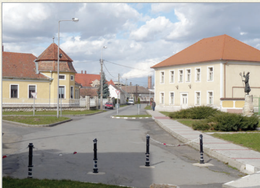
A plébánia épülete