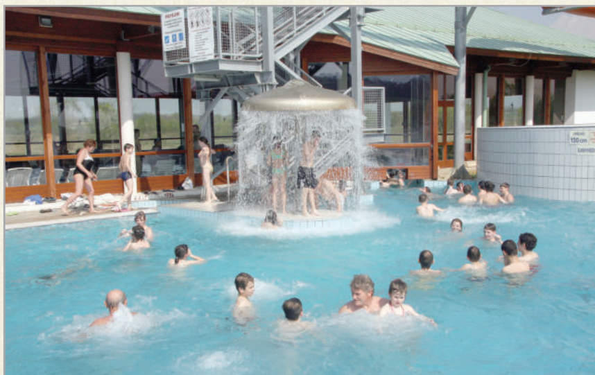
A medencéket élményelemek is gazdagítják