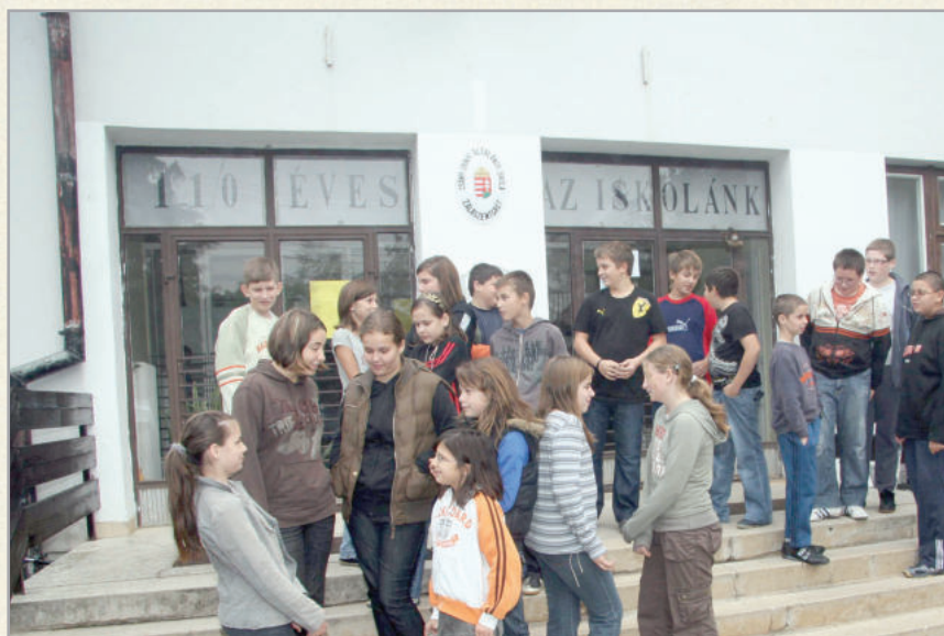
Az általános iskola tavaly ünnepelte 110 éves fennállását