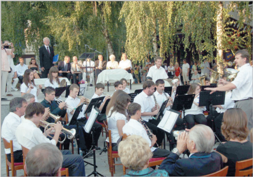
A Városi Fúvószenekar tevékenységét Pro Urbe-díjjal ismerték el