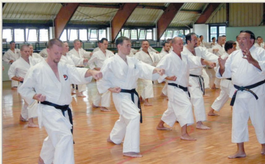
A nemzetközi karatetáborba a világ minden tájáról érkeznek