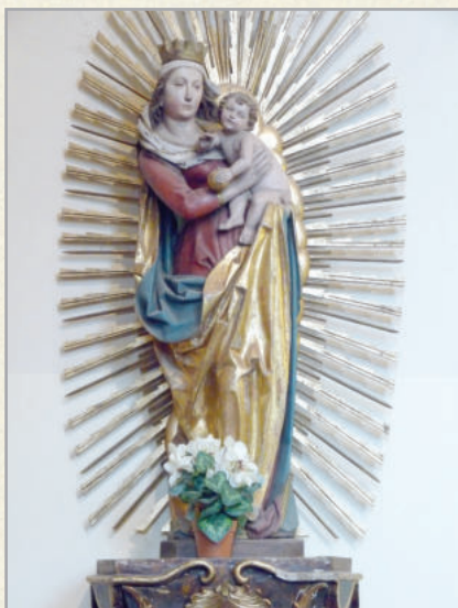
A Madonna-szobor, a templom egyik híressége

Az épületben 14 féloszlop emelkedik, ezeken nyugszik a hármas boltozat: három kupola, cirádákkal díszítve. A szentély – melynek oldalfalain Szent István és Szent László barokk szobrai helyezték el – homlokzatán gróf Batthyány család címere és a templomépítés évszámla látható. Előtte Szent József és Szent Anna oltárai láthatóak, de ezek már a 19. századból származnak.