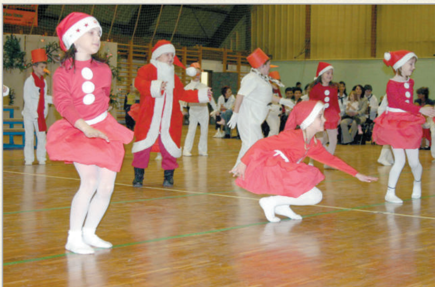
Évente megrendezik a Mindenki karácsonya ünnepséget