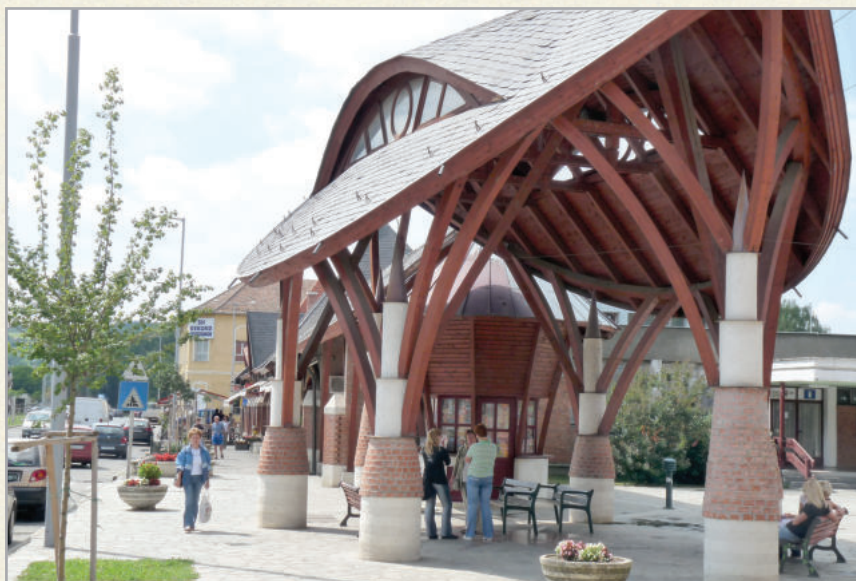
A Főtér Makovecz Imre tervei alapján újult meg