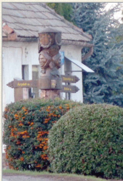
Az utazókat egyedi jelzőablák igazítják el a településen