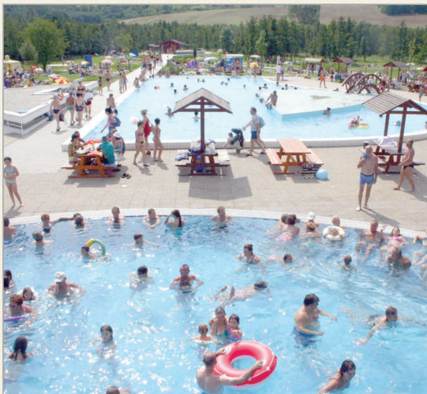
A termálfürdő egy kánikulai hétvégén

Ha az utazó megfárad a sétában, a város, a környék bebarangolásában, jól teszi, ha a Szent Gróth Termálfürdő és Szabadidőközpont felé veszi az irányt. A város határában, Tüskeszentpéter és Zalabér között, szinte mesésen szép természeti környezetben fekszik a létesítmény, mely öt külső és négy beltéri medencével, valamint számos strandoláshoz „kötődő” szolgáltatással várja vendégeit. A vize kiváló összetételű, ezt bizonyítja, hogy ugyanabból a kútból származik, amiből az országszerte kedvelt NaturAqua ásványvizet palackozzák. Az előzetes vizsgálatok szerint gyógyászatra is eredményesen tudják majd használni a fürdő vizét. Hétvégenként és hét közben egyaránt programok várják a létesítmény közönségét.