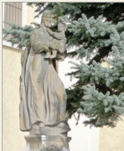
A katolikus templomot szentek szobrai veszik körül