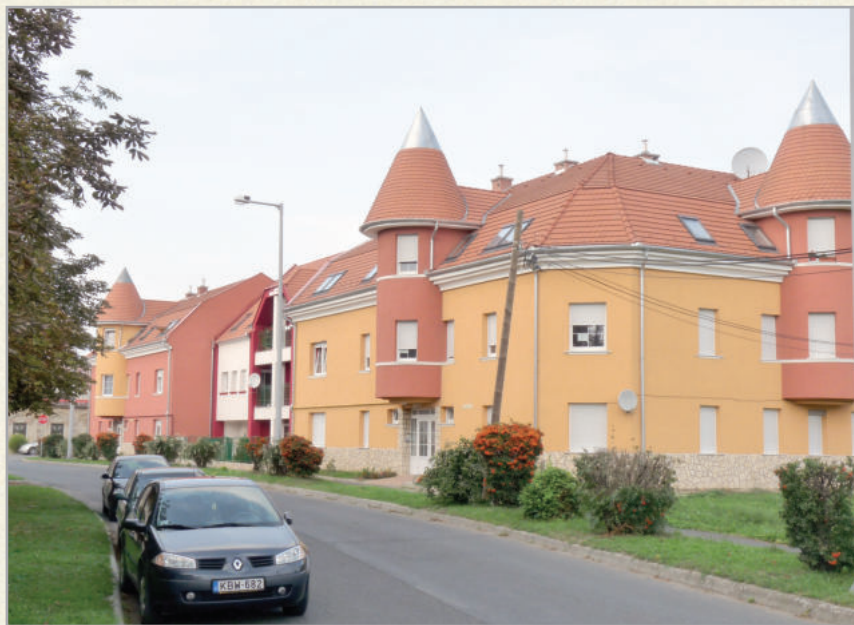
Zalaszentgrót legújabb társasháza meghatározza a városképet

Ahogy az országosan is ritkaságszámba menő, leginkább a hortobágyi kilenclyukú hídhoz hasonlítható műemlék Kőhíd, úgy a Kiskastély is megújult. Utóbbiban városi és tűzoltómúzeum működik. Előbbi a tervek szerint a gyalogos és kerékpáros forgalmat vezeti majd a Termálfürdő és Szabadidőközpont felé.