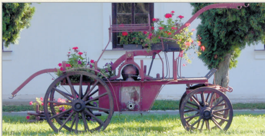
Zalaszentlászló egyik hangulatos közttere a faluház előtt