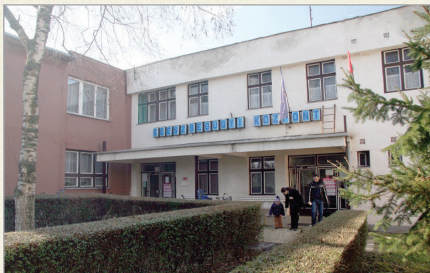
Az Egészségügyi Központ jövőre megújul és bővül