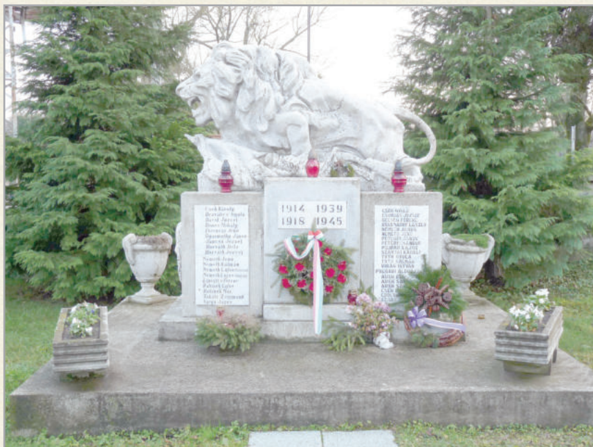
A világháborús emlékmű Kisgörcbön