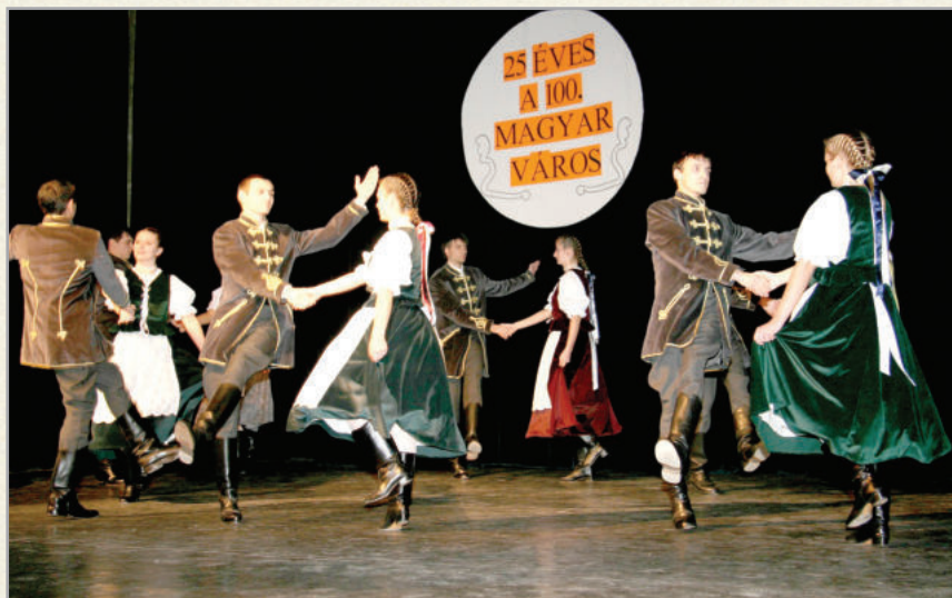
Az Magyar Kultúra Napja, az Arvisura Táncgyűttes fellépése

A városban több kulturális rendezvény is hagyománnyá vált. A Magyar Kultúra Napján a település valamennyi művészeti és kulturális csoportja bemutatkozik. Ezzel a rendezvénnyel veszi kezdetét a kulturális évad. Évenként megrendezik a pütkösi fűvóstalálkozót, a szüreti fesztivált, valamint a nemzetközi néptánc gálát, ám alkalmi kulturális rendezvényekre is sor kerül. A tavaszi és őszi tárlat már közel 40 éves múlt-ra tekint vissza. Országosan is elismert hírű a Zalaszentgróti Színjátszó Tábor, melyre nem csak hazánkából, hanem a határon túlról is érkeznek ifjú színészelöltek. Zalaszentgróton szintén hagyomány a Szent Imre-napi búcsú, ezt az Imre napját követő vasárnap tartják. Hagyománnyá vált Zalaszentgróton a Zalavölgyi Kultúrtivornya elnevezésű program, mely néhány éve nyár közepén egy héten át kínál minden korosztály számára széleskörű programot. De említhetjük a Pusztika Oszika Zala kajak-kenu túrát, ami az elmúlt években országosan ismert és „keresett” rendezvény-nyé nőtte ki magát. Népszerű a természetjárás, így a szüreti barangolások pincétől pincéig elnevezésű túra. A közös adventi gyertyagyújtás és a Mindenki Karácsonya ünnepség is meghonosodott.