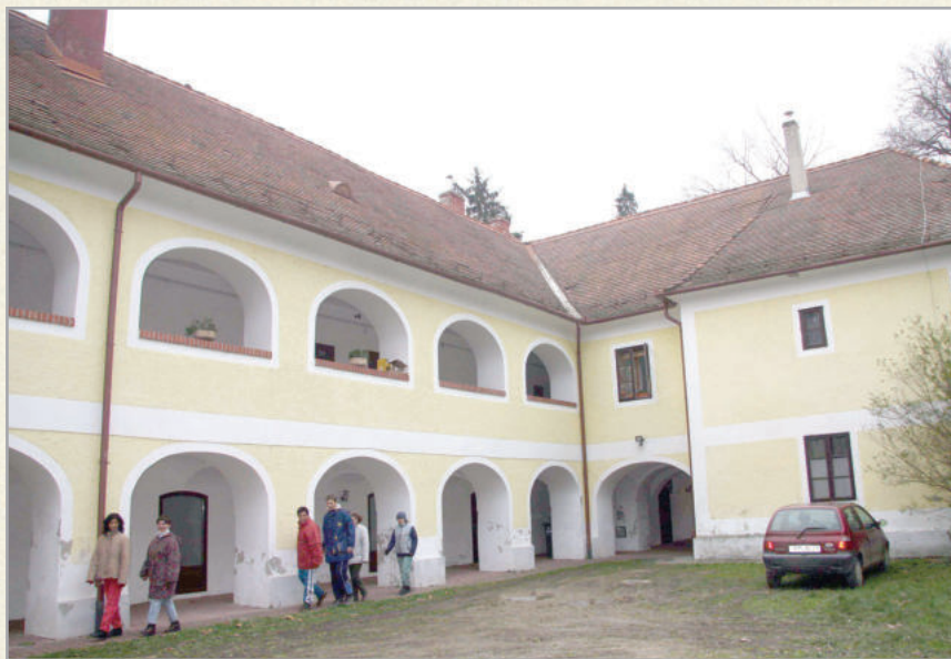
A Kiskastély múzeumoknak és lakásoknak ad helyet

Az Egészségügyi Központ szakrendelése nem csak Zalaszentgrót, hanem a huszonhárom környékbeli település lakosságát is ellátják, ahogy a központi orvosi ügyeletet is a városban vehetik igénybe a környék betegei. A városban két gyógyszertár működik. A Városi Művelődési Központ, Alapfokú Művészeti Iskola és Könyvtár tevékenysége szintén régiós sze-