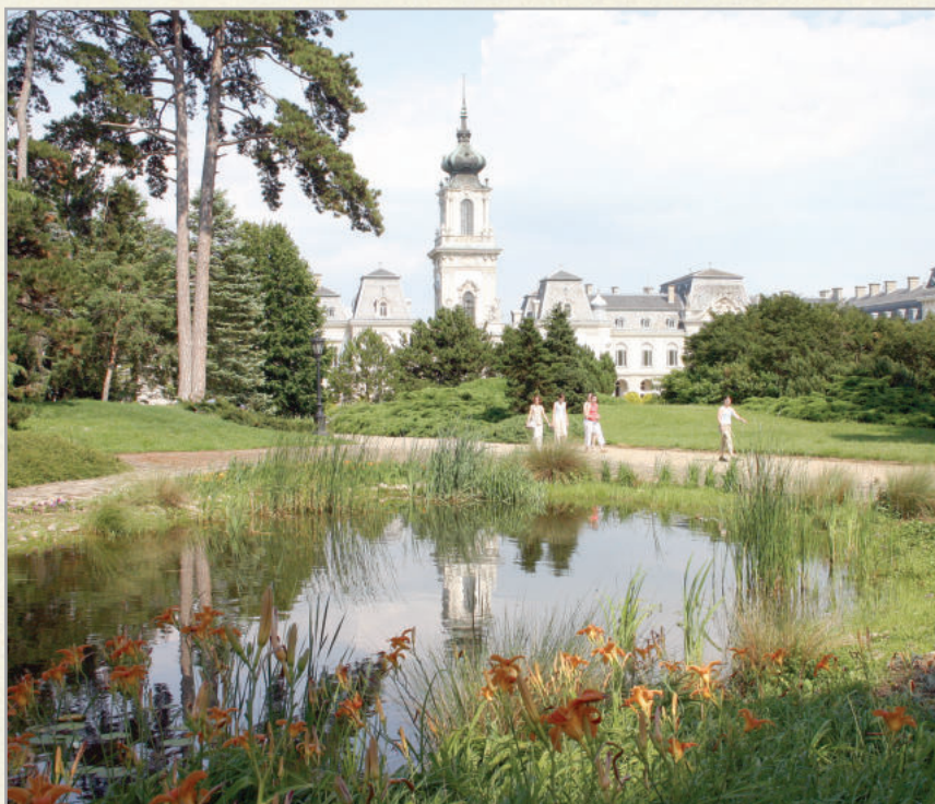
A Festetics-kastély Keszthelyen

Természetesen, ha Keszthelyről, a Balaton kulturális fővárosáról beszélünk, akkor meg kell említeni a fürdőzési lehetőséget, a városban három strand is várja a vendégeket. De természetesen a szomszéd településeken, Gyenesdiáson, Vonyarcvashegyen és Balatongyörökön is megmártózhatnak a Balatonban a turisták.